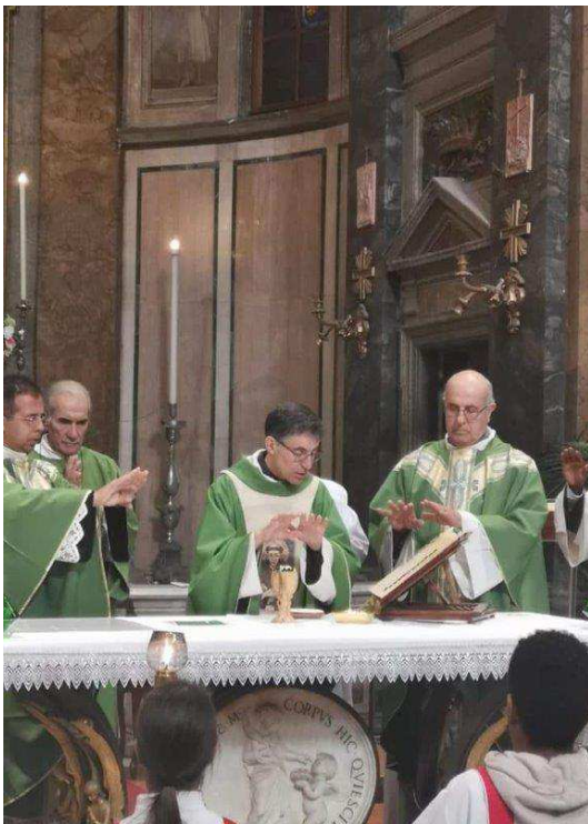
Il nuovo Ministro Generale dei Fratelli Minori Conventuali, Fra Carlos Trovarelli, è venuto a celebrare a Santa Dorotea in occasione del 1° Anniversario della Ordine sacerdotale di P. Romario

L'èquipe d'accordo con i presbiteri si muove avendo come referenti gli operatori pastorali , che vanno motivati e accompagnati nell'opera di ascolto, e la comunità eucaristica domenicale , da coinvolgere almeno a livello di sensibilizzazione e liturgico ( ad esempio: nella preghiera di intercessione per le situazioni incontrate ). In ogni momento dovrà essere possibile ai catechisti o agli animatori rivolgersi ai componenti dell'èquipe per ricevere "lumi" su quanto c'è da fare. Occorrerà muoversi con molta pazienza, creatività, tenacia e lungimiranza.